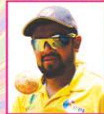
મનન રમેશ છેડા પુનડી