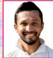
ભવ્ય વિનોદ કુરીયા પ્રાગપુર